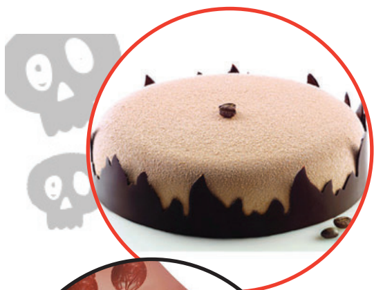
FIOSO Языки пламени

Ингредиенты, материалы и инвентарь для кондитерских изделий и мороженого